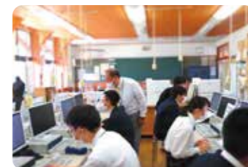
検定までもう少し！

情報や商業に関わる分野の知識やスキルを高め、より多くの資格検定に挑戦して、社会人としての即戦力を身につけます。