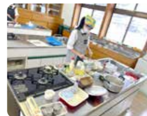
コース料理に挑戦！

衣食住や福祉・保育等に関わる分野についての学びを深め、よりよく生きるための教養を身につけます。