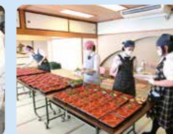
太田分校レストラン