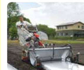
野菜苗の移植準備中

農業実習、販売実習などを通じて専門的な知識や技術を身につけ、農業の魅力に迫ります。