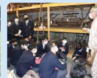
農業関連施設研修