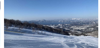
最後はこんなに青空が広がりました