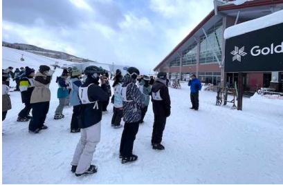
時折青空が見える穏やかな天気でした