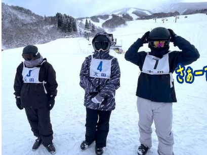
さあー、行きますか!