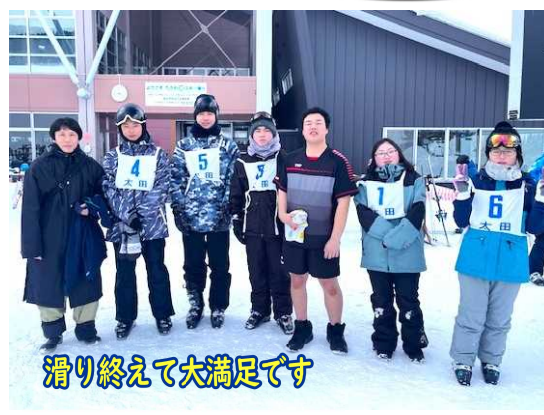
滑り終えて大満足です