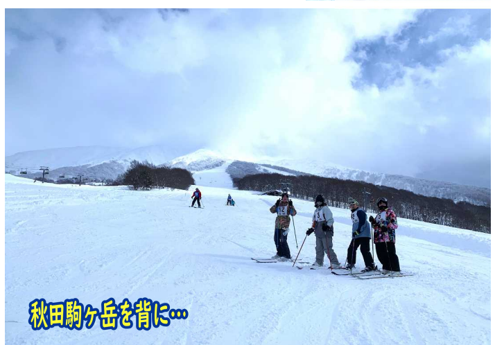
秋田駒ヶ岳を背に...