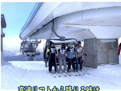
高速リフトから降りる時はとても緊張します(^_^?)