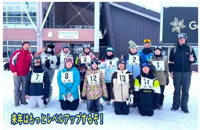
来年はもっとレベルアップするぞ!