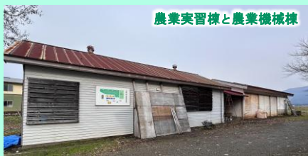
農業実習棟と農業機械棟